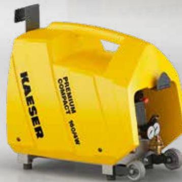
Abb.: PREMIUM COMPACT 160/4W