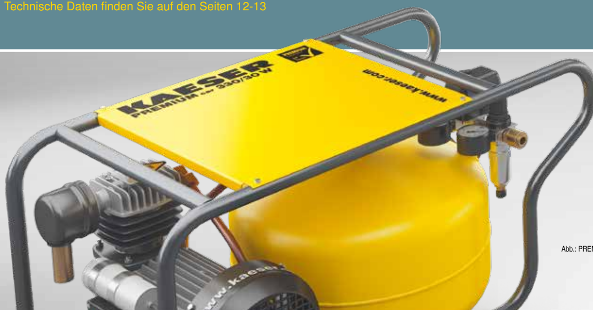
Abb.: PREMIUM CAR 330/30 W