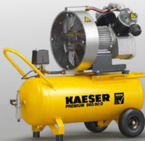
Abb.: PREMIUM 660/90 D