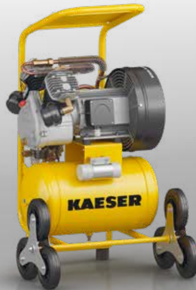
Abb.: PREMIUM COMPACT 450/30W