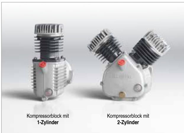
Kompressorblock mit 1-Zylinder