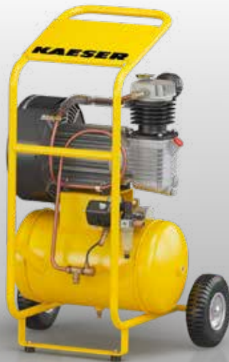
Abb.: PREMIUM COMPACT 350/30W