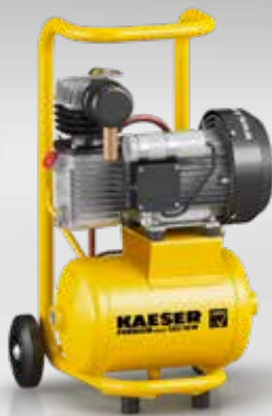
Abb.: PREMIUM SILENT 130/10W