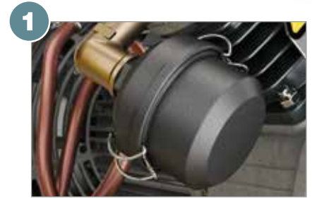
1 Ansaugluftfilter mit Schalldämpfer