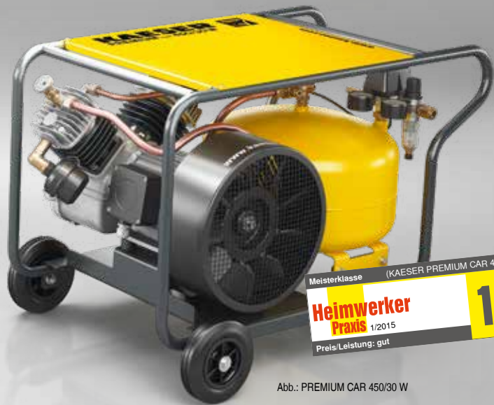
Abb.: PREMIUM CAR 450/30 W