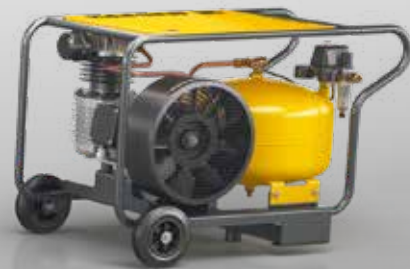
Abb.: PREMIUM CAR 350/30 W