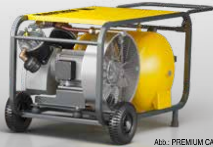
Abb.: PREMIUM CAR 660/70 D