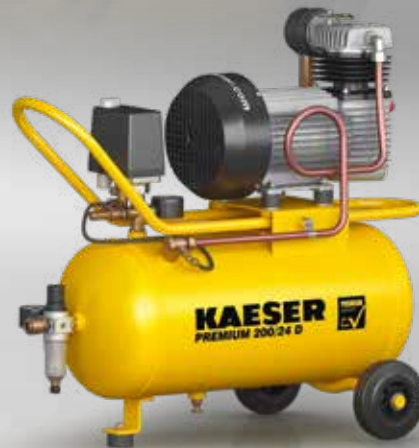
Abb.: PREMIUM 200/24 D