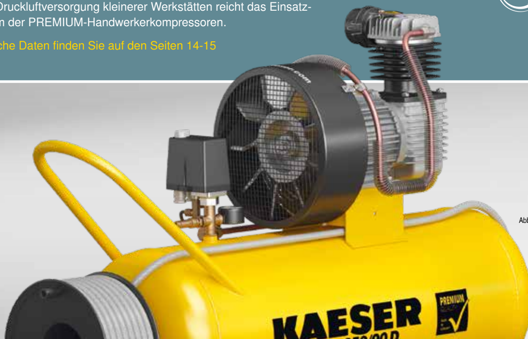
Abb.: PREMIUM 350/90 D