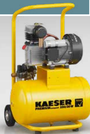
Abb.: PREMIUM COMPACT 250/30W