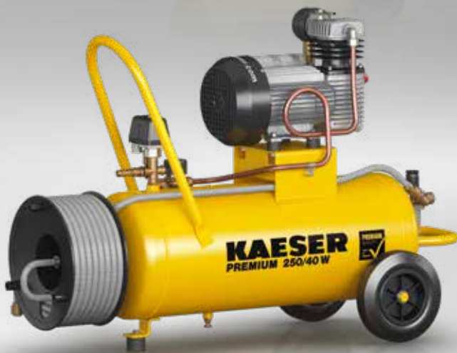
Abb.: PREMIUM 250/40 W