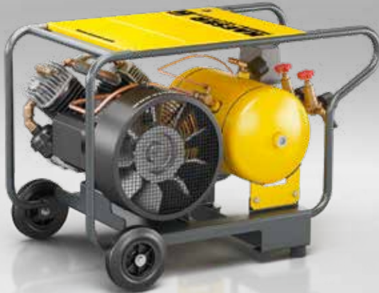
Abb.: PREMIUM CAR 150-2/16 W