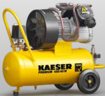
Abb.: PREMIUM 450/40 W