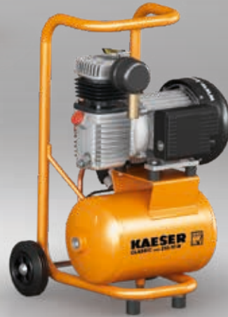
Abb.: CLASSIC mini 210/10 W