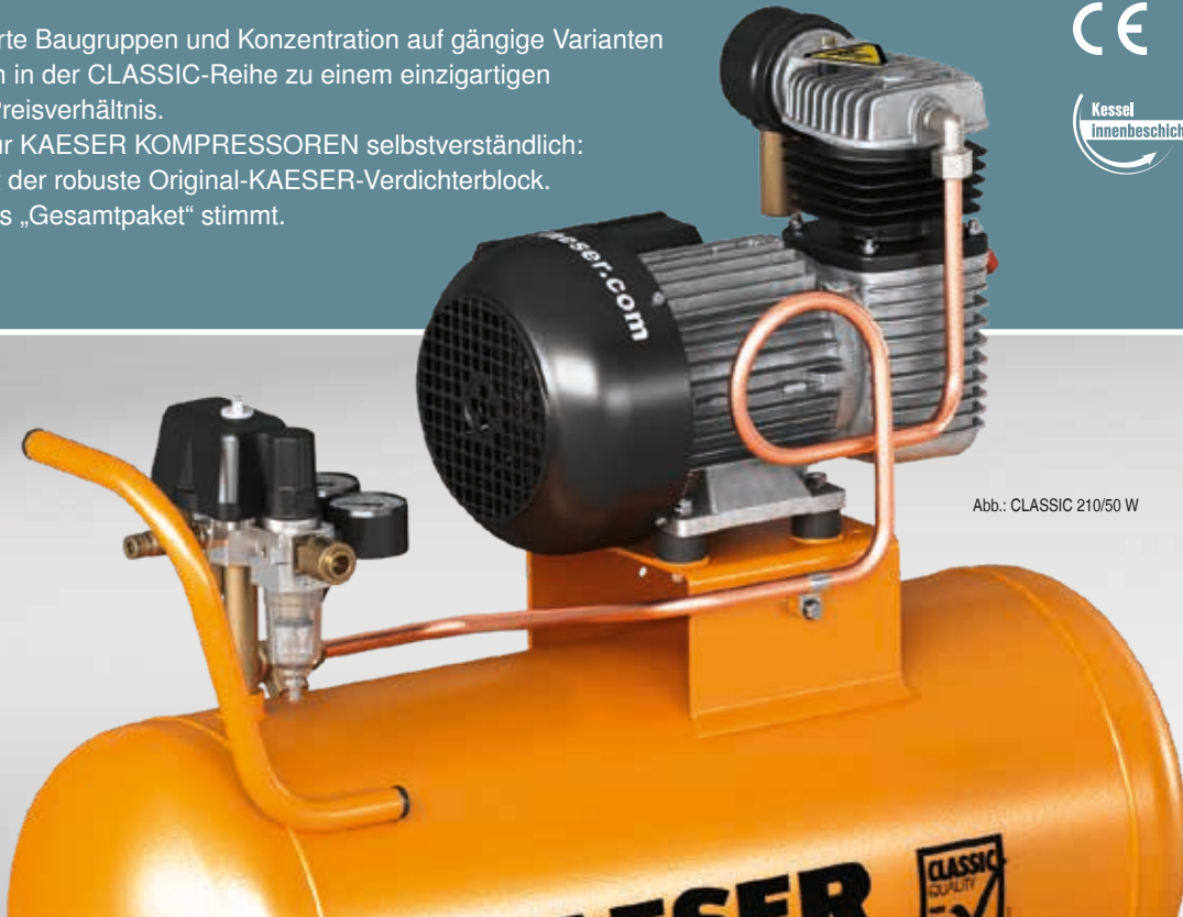
Abb.: CLASSIC 210/50 W