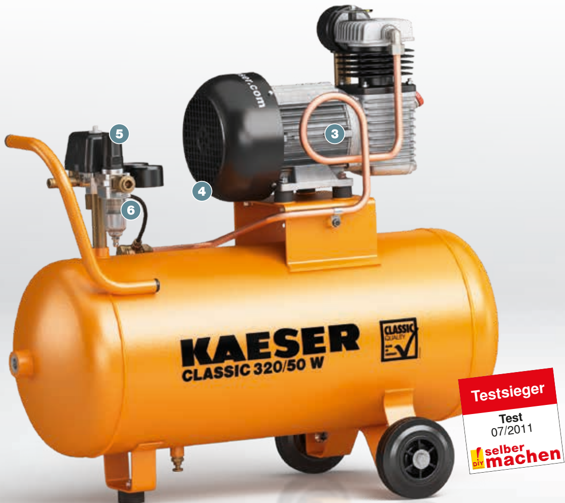
Abb.: CLASSIC 320/50 W