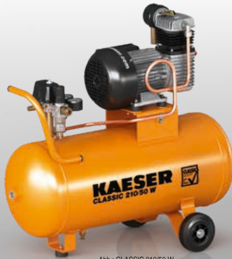
Abb.: CLASSIC 210/50 W