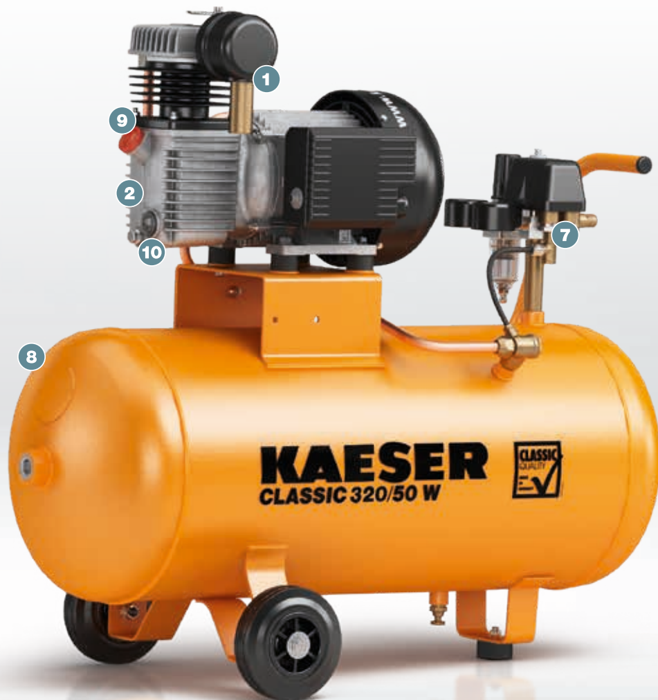
Abb.: CLASSIC 320/50 W