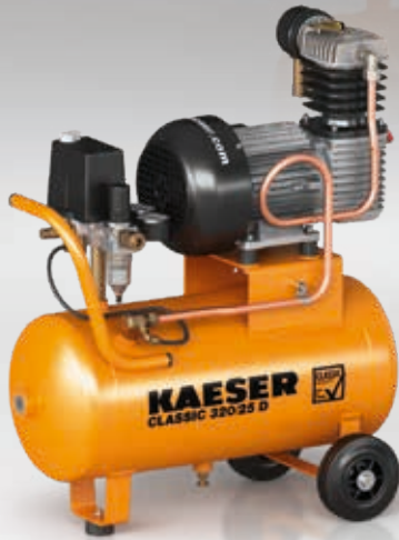
Abb.: CLASSIC 320/25 D