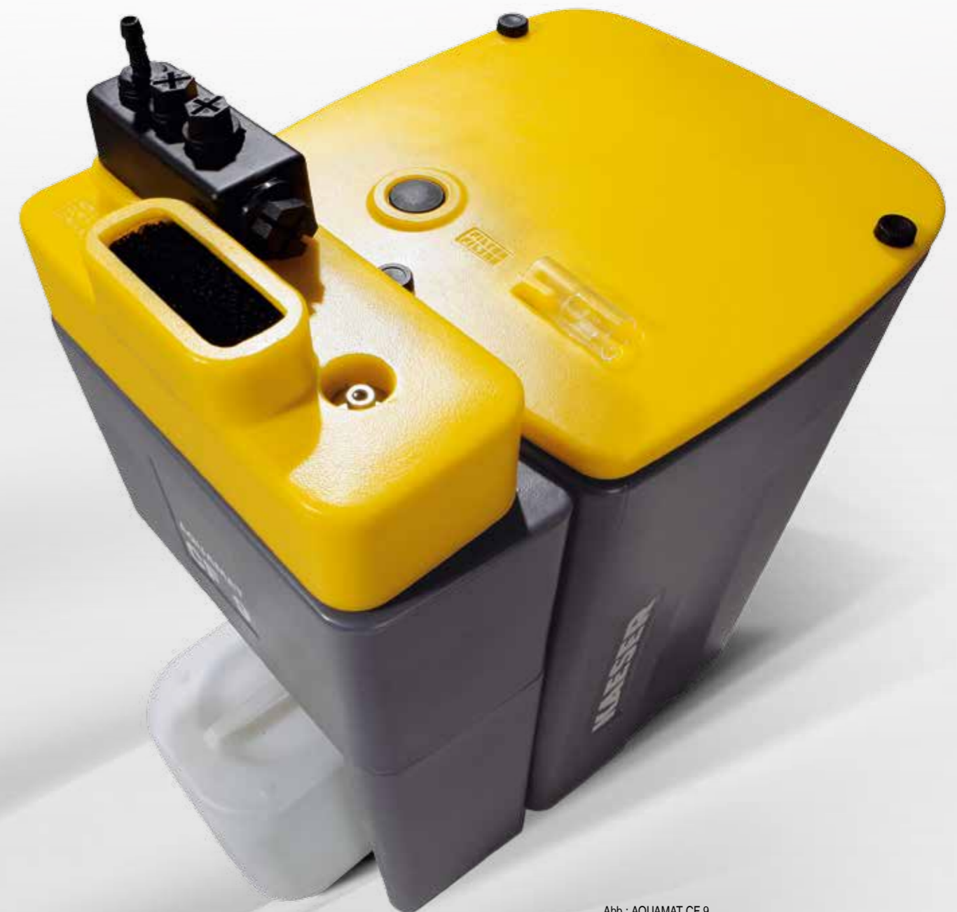
Abb.: AQUAMAT CF 9